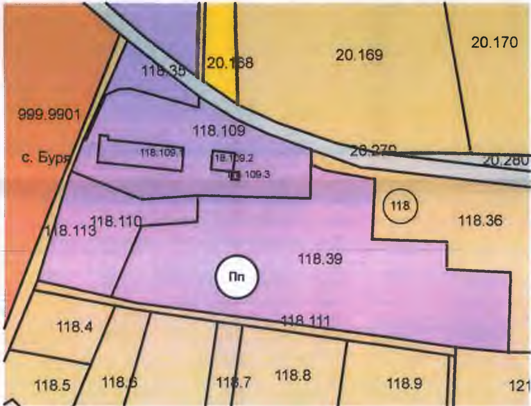
Извадка от действащия ОУПО Севлиево за ПИ 07082.118.35 и ПИ 07082.118.39 по КККР на с. Буря ,Общ. Севлиево М 1:2000